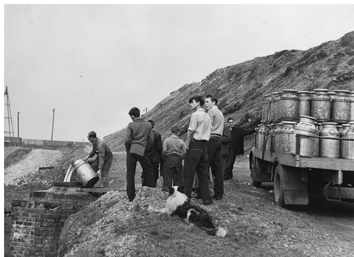
Obrázek 3: Vylévání mléka do kanálů v okolí Windscale

Ve Windscale po havárii JZ došlo k významnému úniku radionuklidů (Wolf, 1959), nejvýznamnějším byl ^{131}\text{I} . Protože k havárii došlo 10. října, jednalo se o zemědělskou oblast a krávy byly v této roční době na pastvinách, došlo k velkému přestupu radionuklidů do zvířat jak inhalačně, tak i ingesční cestou přes kontaminovanou pastvu. Došlo tedy také k velkému přestupu radionuklidů do mléka. Britské úřady stanovily mez pro používání mléka pro lidskou spotřebu na 0,1 \mu\text{Ci } ^{131}\text{I} / \text{l} , tj. 3700 \text{ Bq } ^{131}\text{I}/\text{l} . Protože velké množství mléka tuto mez překračovalo, přijaly jako opatření pro jeho likvidaci vylévání kontaminovaného mléka do kanálů anebo rozlévání na půdu (hnojení mlékem). Takto bylo zlikvidováno 250 000 galonů, tj. 1,1 \cdot 10^6 litrů mléka od 600 stád krav na území 200 – 300 čtverečních mil, tj. 320 – 480 \text{km}^2 . Délka tohoto opatření byla po dobu 2 – 3 týdnů, v souvislosti s poločasem rozpadu ^{131}\text{I} . Na obrázku č. 3 je ukázán příklad vylévání mléka do kanálu.